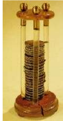
... et sa pile électrique

La pile d'aujourd'hui est basée sur le même phénomène. Elle est constituée de différentes parties :