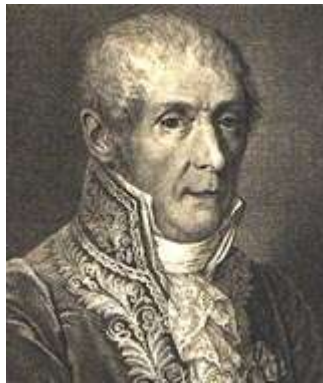
Alessandro Volta ...

La pile électrique a été inventée en 1800 par Alessandro Volta, Italien né à Côme en 1745 et mort en 1827 dans la même ville. Il avait empilé différentes couches constituées alternativement de cuivre et de zinc, séparé par du papier imbibé d'eau salée (cette pile est visible au Musée des Arts et Métiers à Paris). Un phénomène de transfert d'électrons s'effectue entre les différents métaux passant par le milieu salin (plus conducteur que l'eau simple).