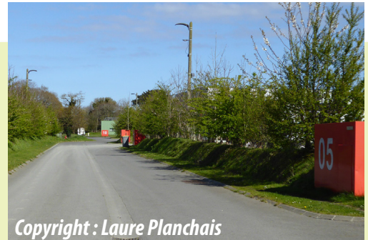
ZAE Kervinadou Développer une signalétique simple, harmonisée et lisible à l'échelle des véhicules en déplacement