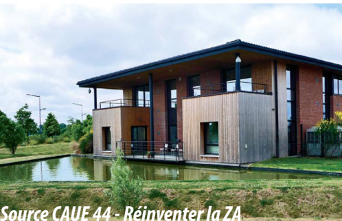
Source CAUE 44 - Réinventer la ZA Parc d'activités de la Haute Borne à Villeneuve d'Ascq (59) Une charte architecturale et paysagère de la ZAE