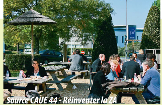
Réinventer la ZA Parc d'activités du Moulin Neuf à Saint-Herblain Diversité des usages : des espaces de convivialité