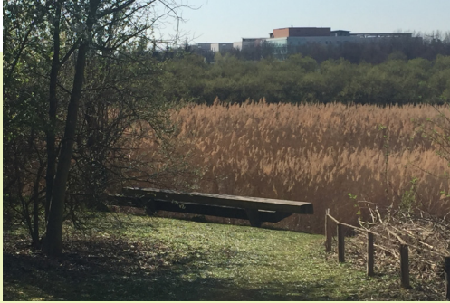
Phase 2 de la ZAC Porte des Alpes (Saint Priest) Des aires repos et de pique nique accueillants, des cheminements de qualité