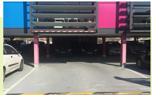
Parc de Sacuny (Brignais) Stationnement en rez de chaussée