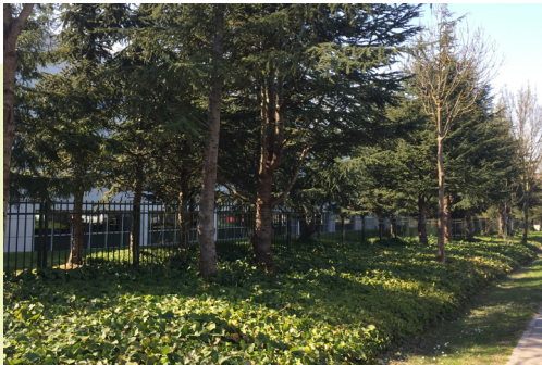
Phase 2 ZAC Porte des Alpes (Saint Priest) Traitement qualitatif des limites à budget raisonnable avec des plantations en lisière