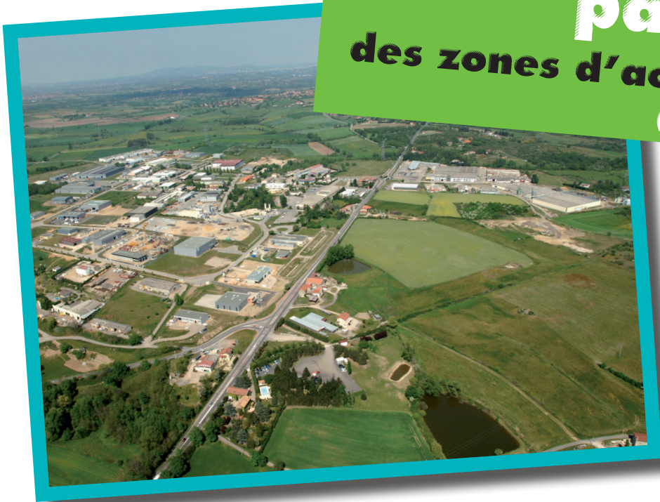
Mornant ZA Les Platières

Créé en août 2008, l'observatoire partenarial des zones d'activités dans le Rhône rassemble 4 partenaires, le SCoT du Beaujolais, les Chambres de Commerce et d'Industrie de Lyon et du Beaujolais et l'Etat (DDT du Rhône), afin d'établir une vision partagée des zones d'activités présentes sur le territoire et de leur évolution dans le temps.