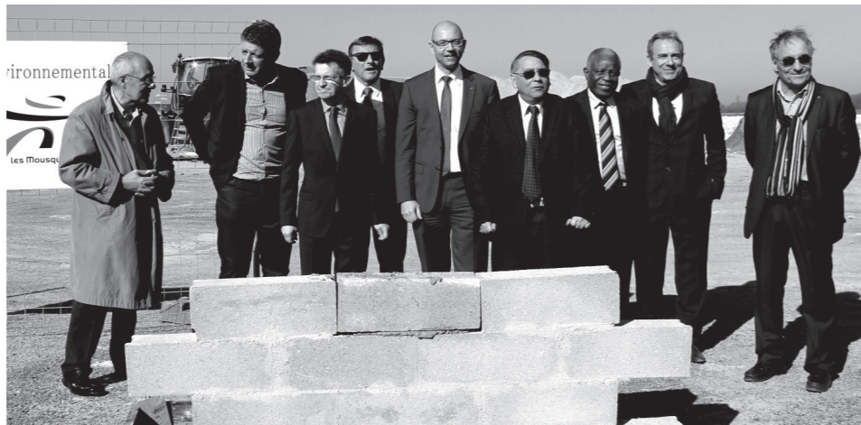
La réussite des Ecoparcs a été mise en valeur la semaine dernière avec la pose de la première pierre de la nouvelle base Intermarché. 250 emplois de plus aux portes de Louviers. Et il se murmure que CINRAM sera bientôt de retour... sur Ecoparc.

UN BON MAIRE, UNE EQUIPE SOLIDE, UN PROJET DYNAMIQUE POUR NOTRE VILLE Voter MARTIN, c'est bien !