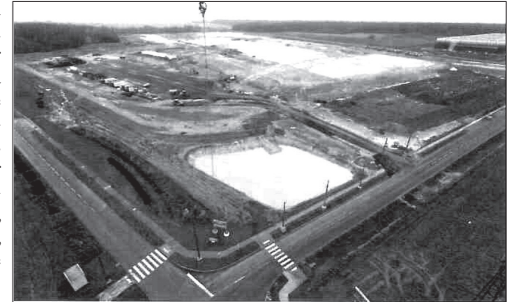
La future base Intermarché en chantier. Parc des Saules, Pharmaparc, Ecoparc I et II : 86 entreprises, 3000 emplois implantés par la CASE

Aujourd'hui, notre stratégie est claire : la CASE investit massivement pour implanter les entreprises sur les parcs d'activités autour de Louviers et de Val-de-Reuil. Le produit fiscal de ses implantations alimente le budget commun de la CASE et lui permet d'investir dans la commune, comme le montre l'exemple de la piscine... qui ne coûte rien à Louviers. Sur le territoire de la commune, il faut soutenir les activités non-industrielles porteuses d'emploi : bureaux, artisanat, commerce, professions libérales et de santé... Cette stratégie gagnante a permis d'implanter près de 3000 emplois aux portes de Louviers.