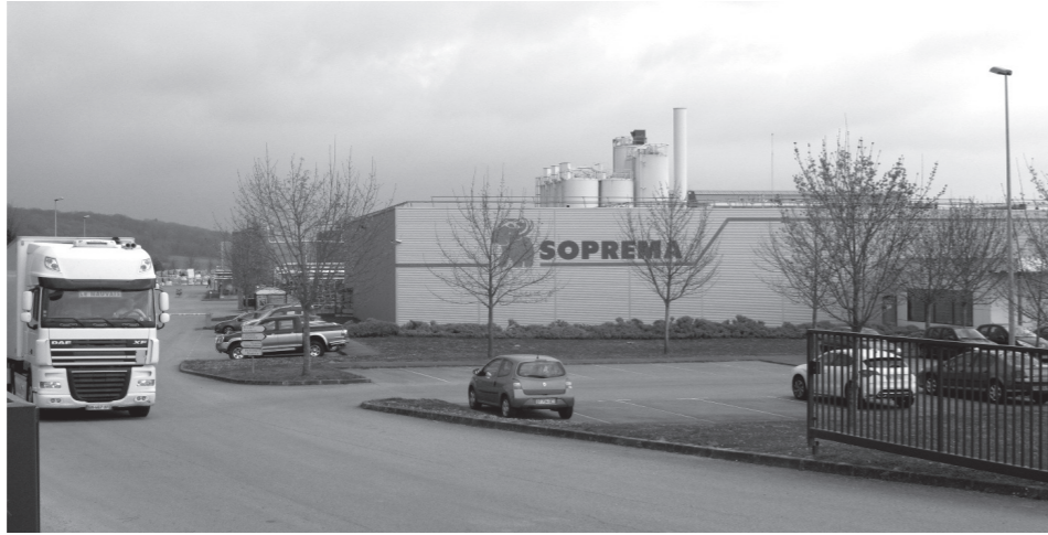
L'exemple gagnant-gagnant de la SOPREMA démontre que la réussite du développement économique et de la création d'emploi est liée à la CASE

Chaque année, la CASE reverse à la Ville de Louviers le montant de l'ancienne taxe professionnelle, fixé au moment