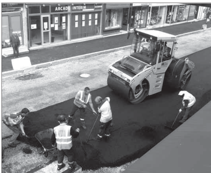
Les engins de chantier à l'œuvre rue du Maréchal Foch

Beaucoup a été fait, beaucoup reste à faire. La première tranche de la rue du Bal Champêtre est finie, deux autres vont suivre. La rue Leroy Mary va bénéficier d'un premier lifting. Autour des grands chantiers de logement et de rénovation urbaine, à Maison Rouge comme autour de la rue des Martyrs de la Résistance, la voirie sera rénovée à la fin des chantiers. Et, dans tous les quartiers de Louviers, l'entretien et le renouvellement de l'ensemble du réseau, en fonction du degré d'usure, sera poursuivi à rythme soutenu.