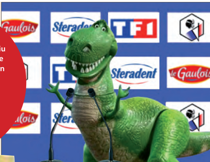
I dinosauri ùn sò micca tutti smarriti : ci hè sempre l'associu France-Corse !

01/04 - Cunferenza di l'associu paleoliticu France-Corse : « le concept de coofficialité est un piège » (Corse-Matin). A sera stessa, c'eranu 2500 persone pè a festa di u cullettivu Parlemu Corsu in Corti.