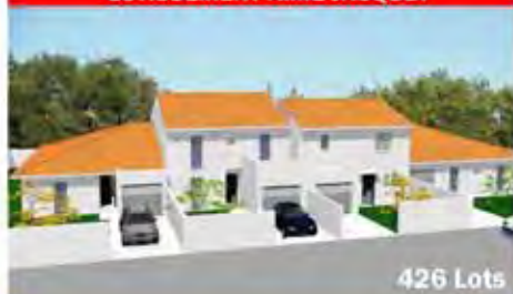
LOTISSEMENT AIMÉ JACQUET