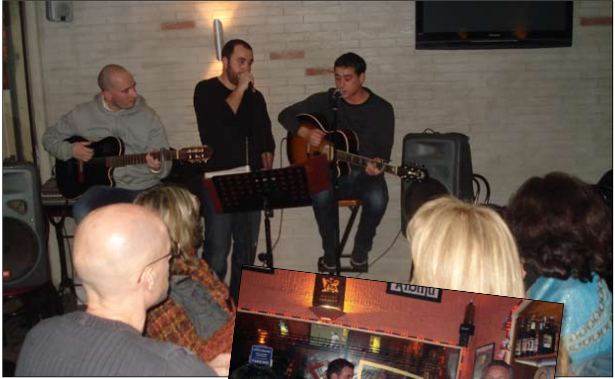
Sax caffè, Corsica Bar è Penalty