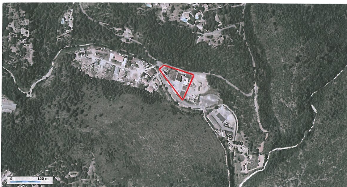
Figure 1. Vue aérienne du site de Peymeinade

La plateforme de compostage se situe dans le vallon de la Frayère sur la commune de Peymeinade au lieu dit « Le Gabre », à 1.5 km au Sud Est du centre. A 200 mètres du site, se trouve la station d'épuration de Picourenq.